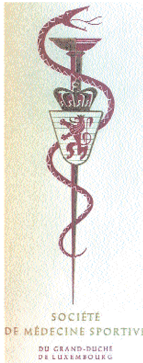
Premier logo de la Société S.L.M.S.